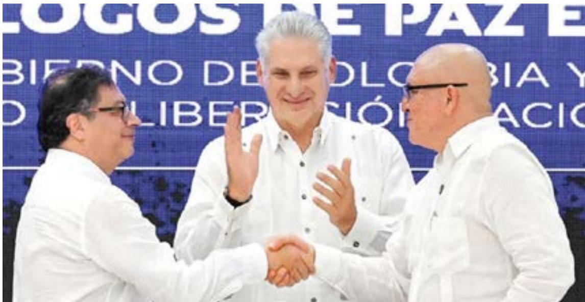
Petro acepta comisión internacional para verificar desconexión del ELN con el narcotráfico.