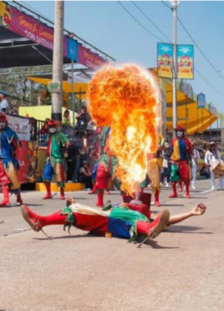
De Sabanalarga llega el fuego y el baile a llenar el Cumbiódromo con el legado de Gastón Polo.