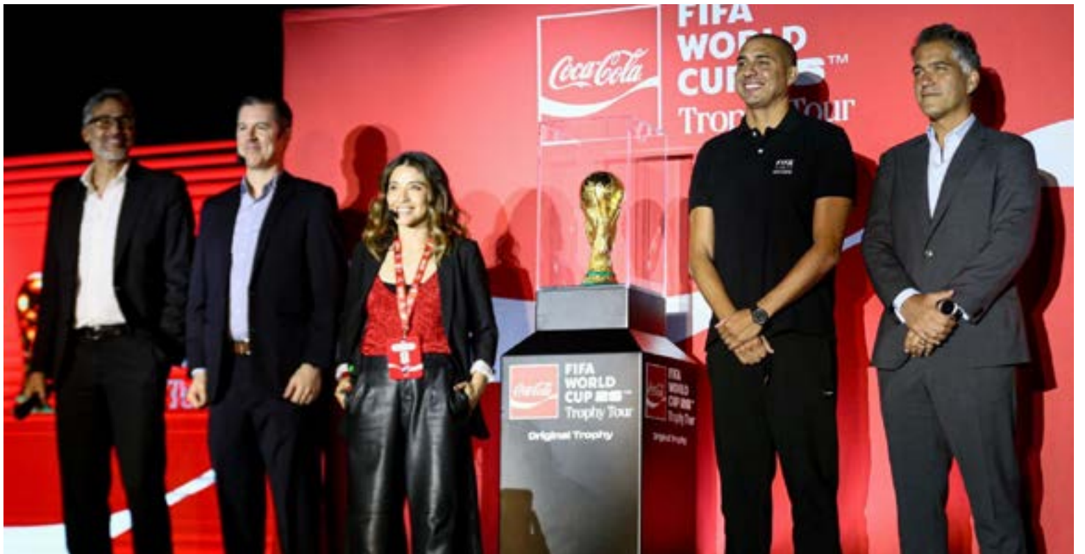
La FIFA designó como custodio de esta joya al exfutbolista francés Christian Karembeu, icónico campeón en «Francia 1998» y antigua gloria del Real Madrid.

La elección de Bogotá como parada principal de esta gira por Sudamérica no es fortuita, pues responde a la «exorbitante demanda de boletería» que el público colombiano ha registrado para el torneo que