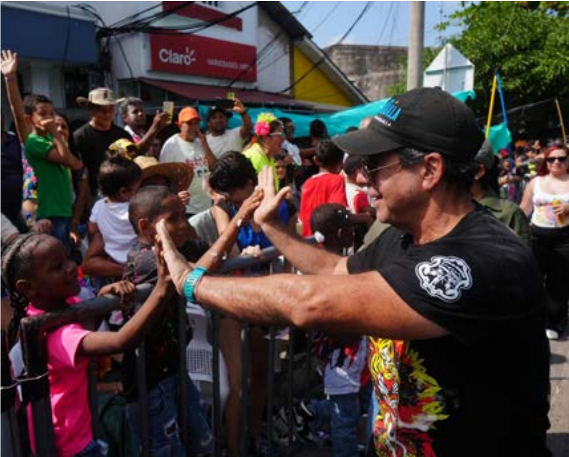
Alejandro Char, alcalde Barranquilla, acompañó a los carnavaleros y hacedores, compartiendo con ellos la tradición, y reafirmando que el Carnaval es identidad, es memoria viva y, sobre todo, es de todos.