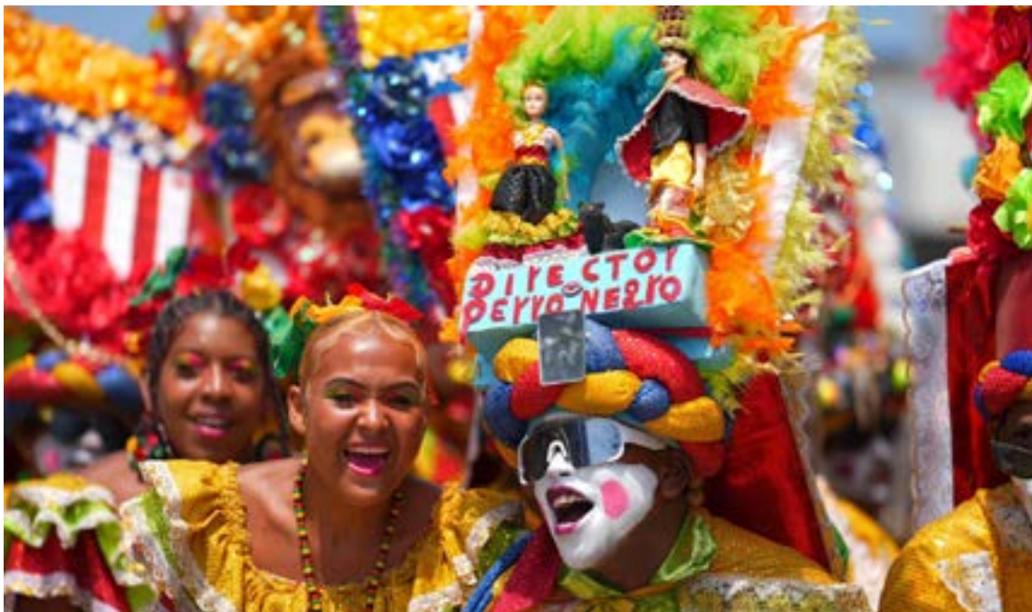
Ya llegaron los guardianes del Carnaval en sus cuadrillas de guerra y alegría a la Gran Parada de la Tradición.