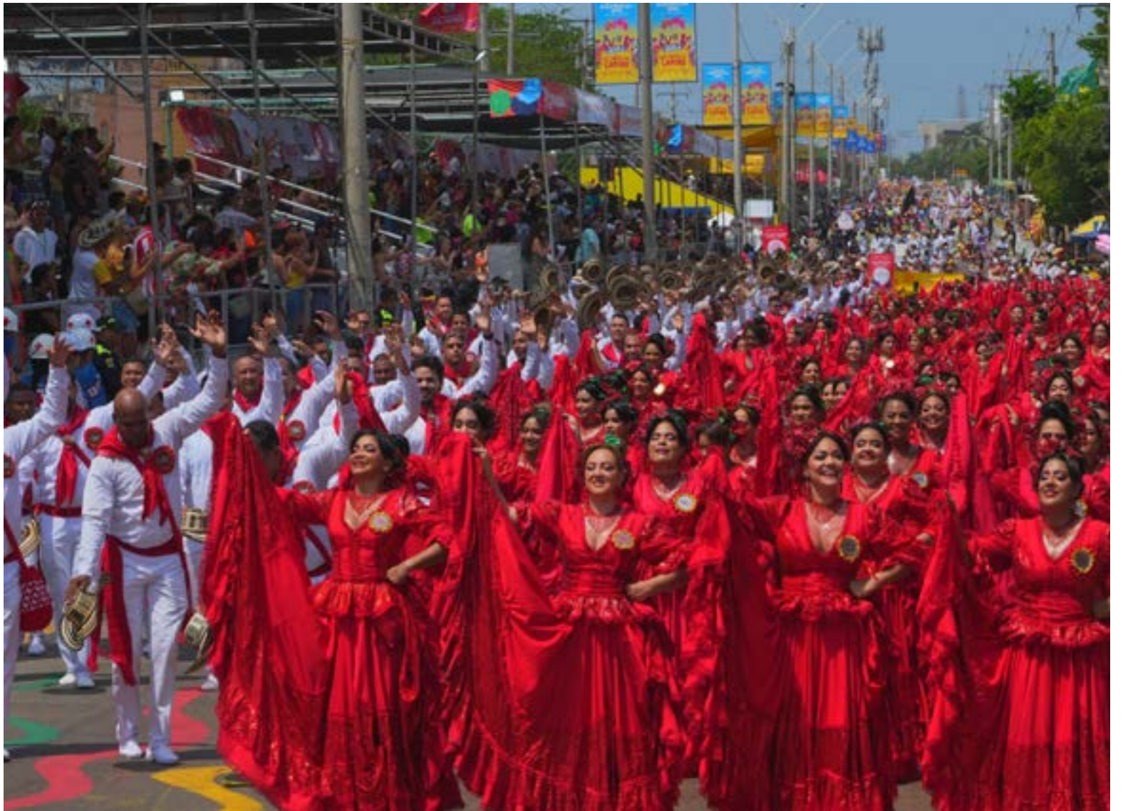
¡Baila cumbia, baila la Gigantona!

E l Carnaval de Barranquilla 2026 se consagra como una explosión de identidad donde el río Magdalena y el mar Caribe convergen en un despliegue de danzas ancestrales, disfraces satíricos y comparsas rítmicas. Bajo el lema de la salvaguardia de su patrimonio, la «Arenosa» vibra con la Batalla de Flores y el Festival de Orquestas, reafirmando por qué esta fiesta es la expresión folclórica más importante de Colombia. La edición de este año destaca por una integración tecnológica que exalta la tradición, permitiendo que el legado de la cumbia y el congo resuene con fuerza ante miles de visitantes del mundo entero.