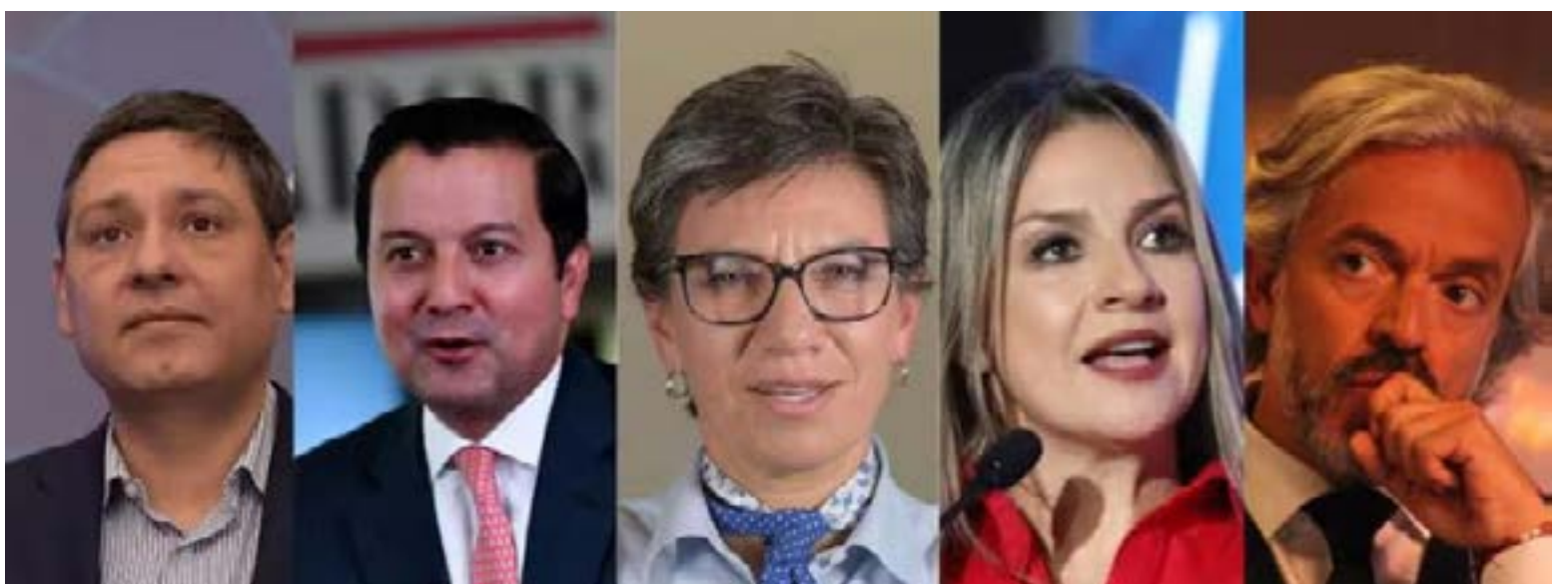
Figuras como Lizcano, Luna, López, Dávila y Oviedo han comenzado a ceder terreno ante la polarización, quedando rezagados en las encuestas frente al avance de los sectores más radicales. A medida que se decantan las preferencias, estos nombres luchan por romper el techo del margen de error para evitar el ostracismo en el tarjetón de marzo.

simbólica como las peregrinaciones religiosas en Monserrate para «levantar» su favorabilidad. Finalmente, el voto en blanco y el porcentaje de indecisos, que sumados superan el 35% en algunas regiones, se perfilan como el verdadero botín de guerra. El país llega a las urnas de marzo no solo para elegir nombres, sino para definir si opta por la continuidad del modelo actual o por un giro drástico hacia la derecha, en una de las elecciones más polarizadas de la historia reciente.