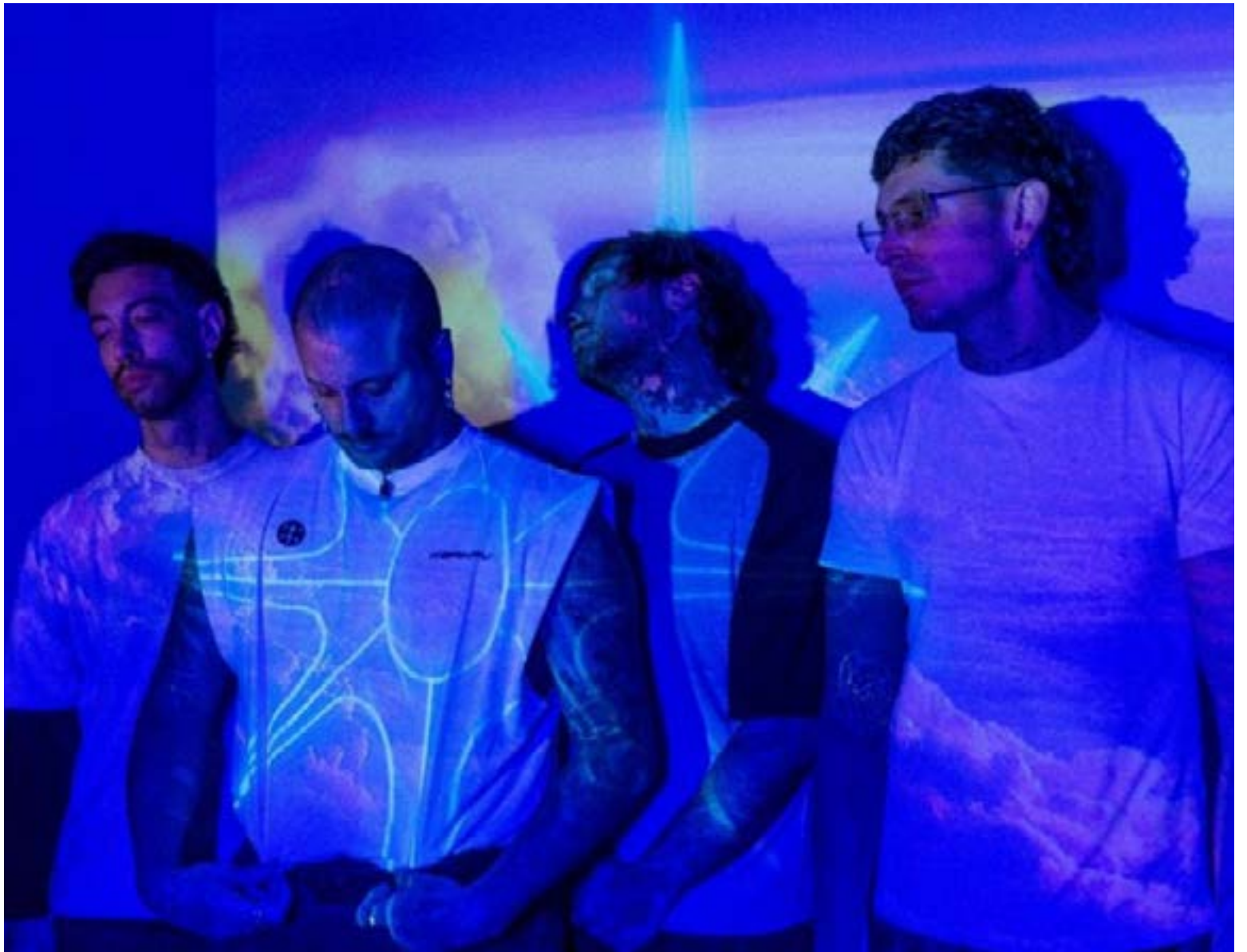
Bogotá se suma al recorrido del 'Por Siempre Tour'

Con una sólida carrera iniciada en 2007, la agrupación busca consolidar su vínculo con el público local mediante un espectáculo que integrará sus éxitos clásicos con material reciente, como su tema 'Legado'. El evento, organizado por G3 Records, ya tiene sus entradas disponibles a través de la plataforma Biciq para los seguidores del circuito regional