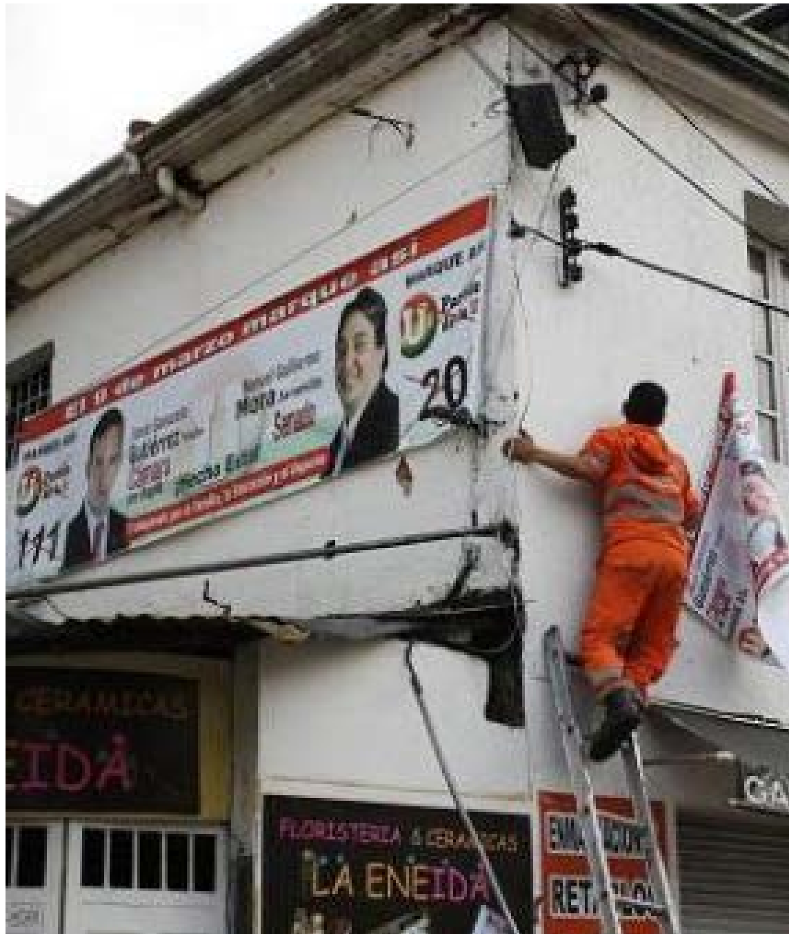
Colectividades como el Centro Democrático, Pacto Histórico, Salvación Nacional, Partido Verde y los partidos tradicionalistas encabezan la lista de infractores de publicidad en Bogotá. El Distrito ya identificó a ocho partidos y 13 candidatos que saturan el mobiliario urbano con propaganda ilegal, enfrentando multas millonarias.

La «guerra de los carteles» no distingue ideologías ni respeta el patrimonio; desde puentes peatonales hasta cajas de semáforos, la ciudad gime bajo el peso de 1.706 elementos retirados apenas en la última semana. Mientras los candidatos prometen orden y progreso en sus