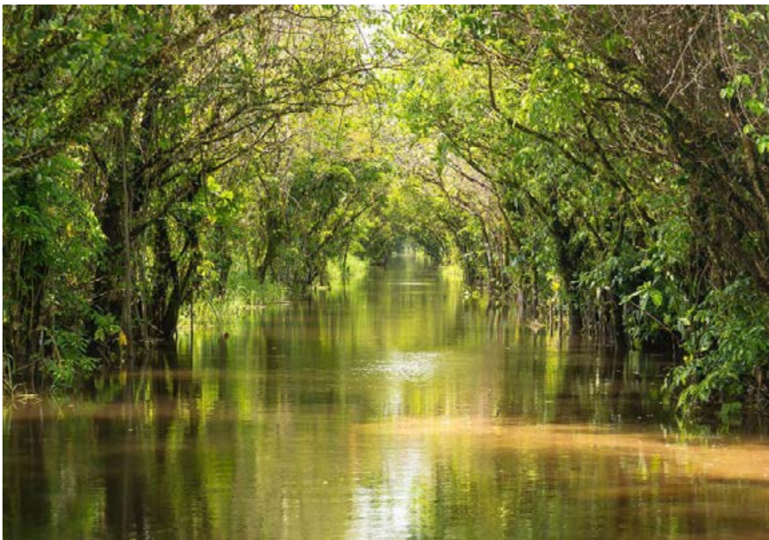
El Canal Roy fue construido por los esclavos hacia 1735 para permitir la unión entre el río Kaw y el río Approuague, facilitando así el transporte de mercancías.

Las Naciones Unidas están interesadas en el estudio y conocimiento de esta zona biodiversa reguladora de la temperatura y el clima del mundo. Pero la atención científica siempre ha estado concentrada en la Amazonia, «Pulmón de Selva»; el Escudo Guayanés es geoestratégicamente rico, valioso por el sistema hídrico, sus paisajes, minerales e hidrocarburos, fauna y flora endémicas, sobre lo cual