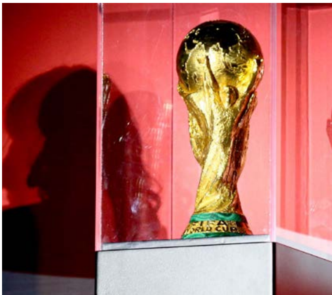
El trofeo de la Copa Mundial de la FIFA no es solo el galardón más anhelado del deporte, sino una verdadera obra maestra de la orfebrería italiana. Su diseño representa a dos figuras humanas que emergen de la base en líneas helicoidales para sostener un globo terráqueo.

iniciará en junio. Los aficionados no solo contemplaron el oro del trofeo, sino que se sumergieron en una experiencia inmersiva que incluyó reliquias históricas y tecnología de realidad aumentada para previsualizar los imponentes estadios de Estados Unidos, México y Canadá.